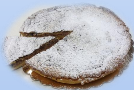
Crostata al pistacchio