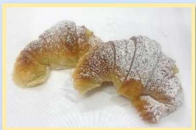
54. Salata con crema