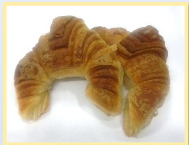
53. La Salata