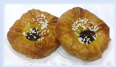
17. Fagottino Cioccolato