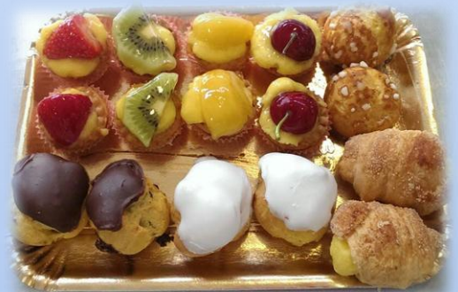
42. Piccola pasticceria dolce