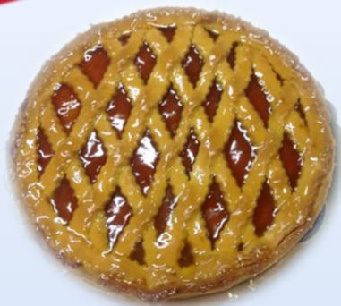
Crostata con marmellata di albicocca