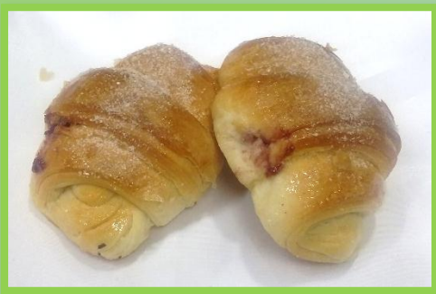
45. Vegana con confettura ai frutti di bosco