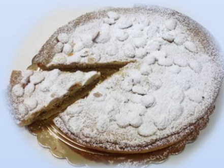
Crostata alla ricotta