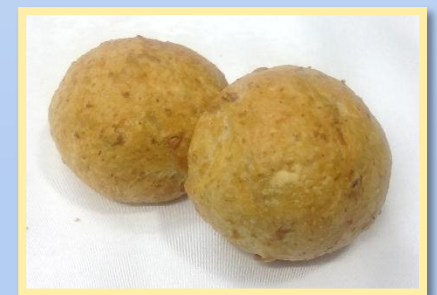
66. Zinzi Integrali