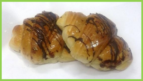
43. Vegana al cioccolato