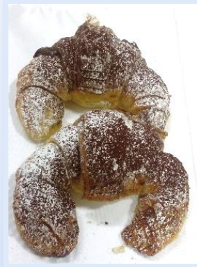
6. Cornetti Cioccolato