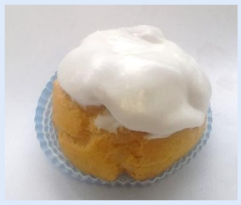
36. Bignè Grande alla crema