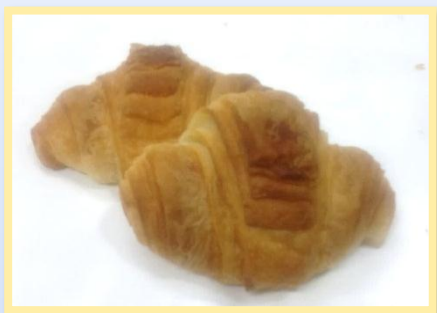
63. Polacche Grandi o Piccole