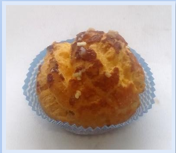
38. Bignè Grande allo zabaione