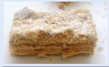
40. Millefoglie allo zabaione