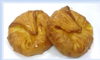
18. Fagottino con crema al limone