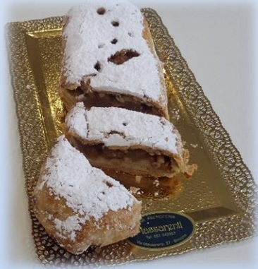
Strudel di mele