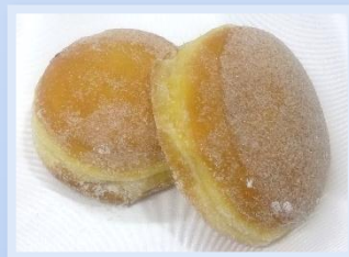
28. Bombolone Marmellata