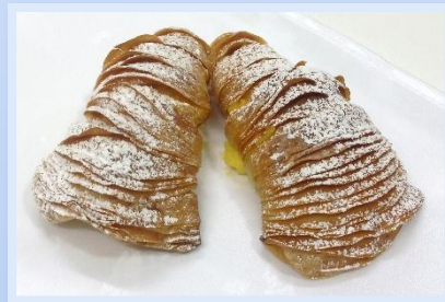
8. Sfogliatelle alla crema