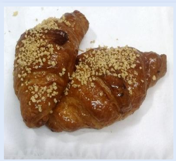
22. Integrale al Miele