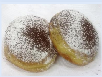
27. Bombolone Cioccolato