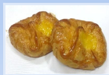
15. Fagottino Ananas