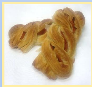
61. Treccia Prosciutto