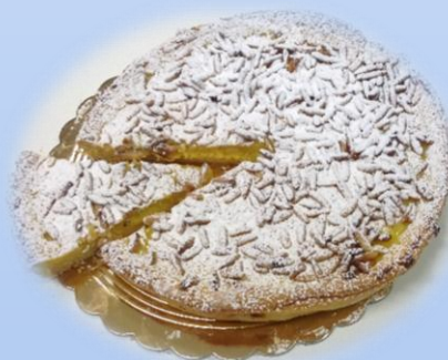
Torta della nonna