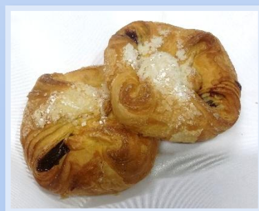
19. Fagottino Frutti di Bosco