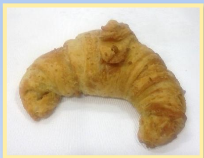
57. Salata Integrale