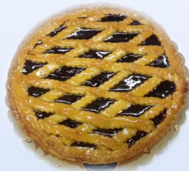
Crostata con marmellata ai frutti di bosco