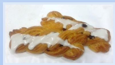
24. Trecce Senza crema