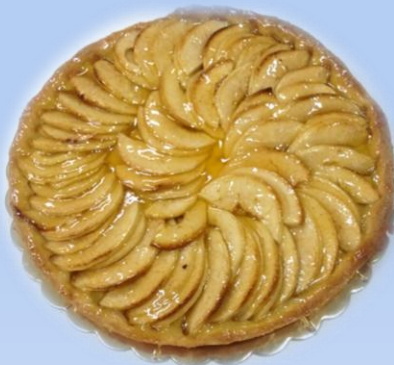
Torta di mele