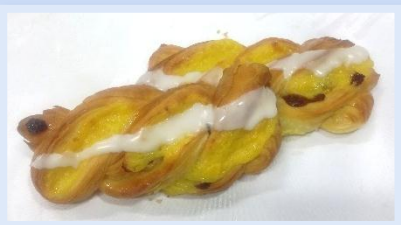
23. Trecce Crema & Uvetta