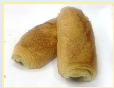
58. Calzone spinaci