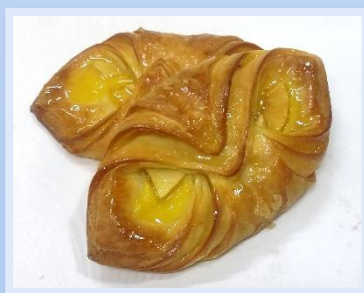
14. Fagottino Mela