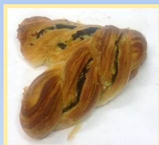
62. Treccia Spinaci