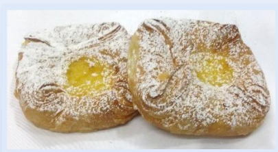
16. Fagottino Ricotta