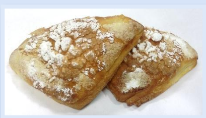
12. Triangoli Crema