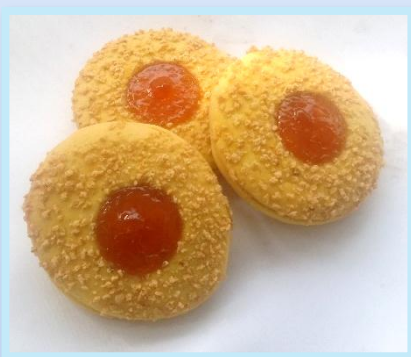
49. Occhi di Bue e granella di mandorle

Pasta frolla con marmellata di albicocca