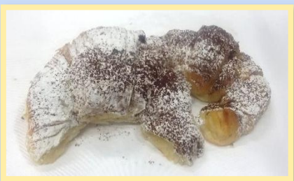
55. Salata con nutella