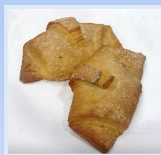
20. Michette Impasto salato ricoperto con zucchero caramellato e ripieno di marmellata di albicocche