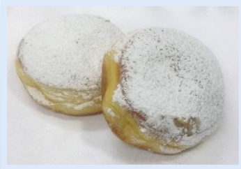
Bombolone 26. Crema