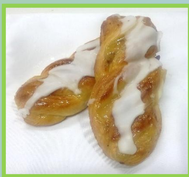
47. Treccia vegana Con crema e uva sultanina