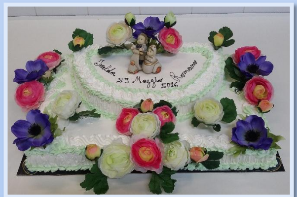
Torte per compleanni e cerimonie