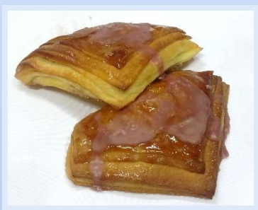
13. Triangoli Amarena e crema