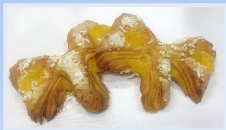
25. Farfalle alla crema