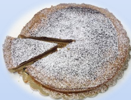
Crostata alla nutella