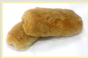
59. Calzone Prosciutto