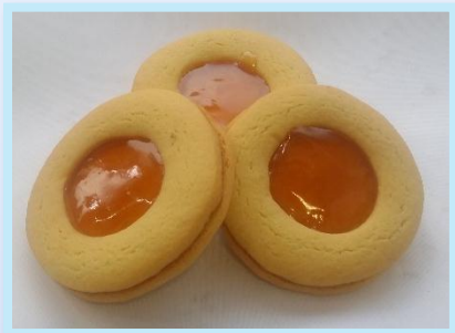
48. Occhi di Bue

Pasta frolla con marmellata di albicocca