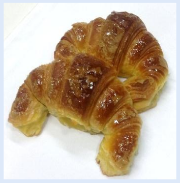
1. Dolce Vuota