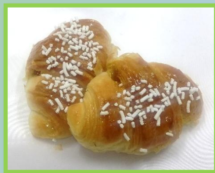
46. Vegana con confettura di albicocche