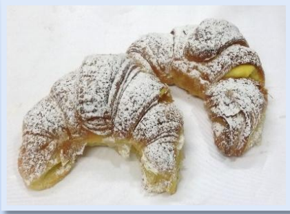
2. Cornetti Crema