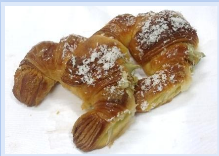
4. Cornetti Pistacchio