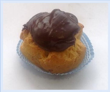
37. Bignè Grande al cioccolato