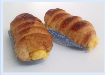
41. Cannolo Alla crema