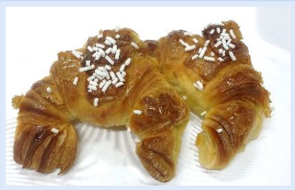
3. Cornetti Marmellata