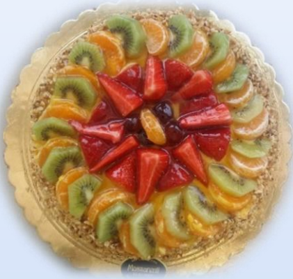
Torte con pandispagna o pasta frolla (crostata) Alla frutta