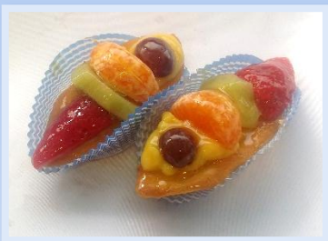
39. Barchetta alla frutta