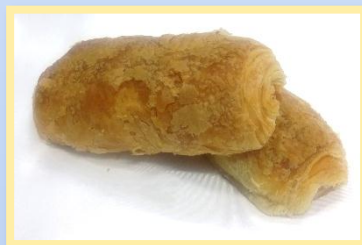
60. Calzone Vuoto