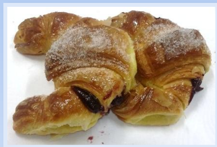
5. Cornetti Frutti di Bosco