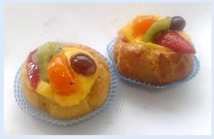
35. Bignè Grande alla Frutta