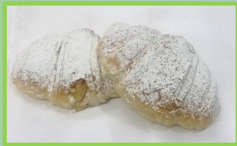
44. Vegana alla crema